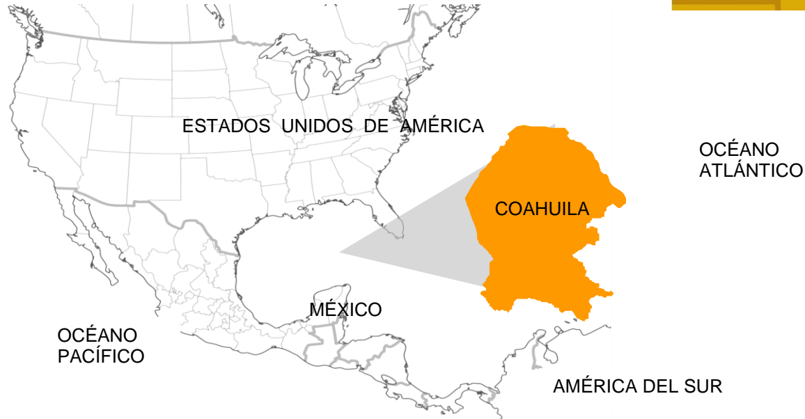
Ubicación de Coahuila de Zaragoza en Norteamérica.